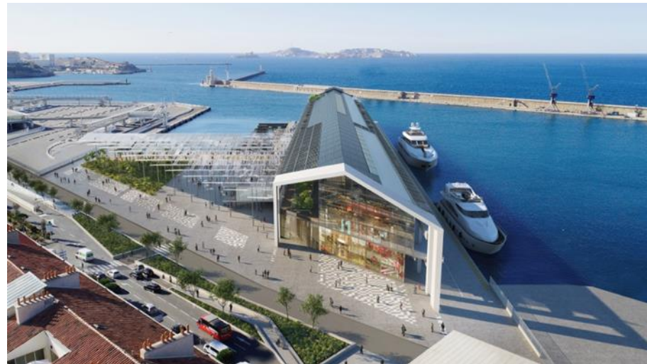
(J1) LA PASSERELLE